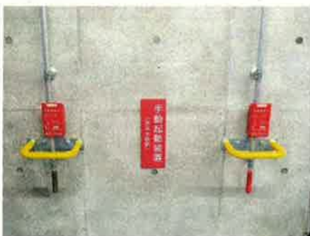
手動起動装置に保護ガードを設置