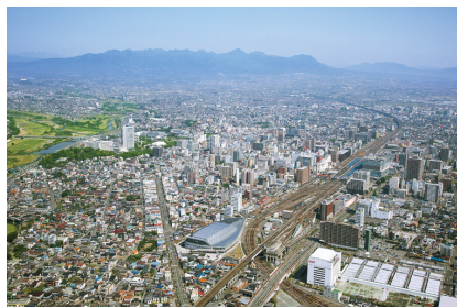
①関東と信越つなぐ高崎市

高崎市は、広大な関東平野の北端に位置する、群馬県を代表する都市です。市の人口は約37万人。市内を走る高速道路は、関越自動車道・上信越自動車道・北関東自動車道があり、新幹線も上越新幹線・北陸新幹線を有する北関東の交通の要衝で、地元の上毛かるたでも「関東と信越つなぐ高崎市」①と詠われています。