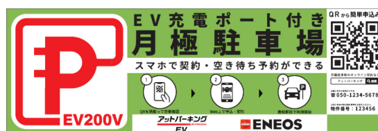
募集看板のデザイン